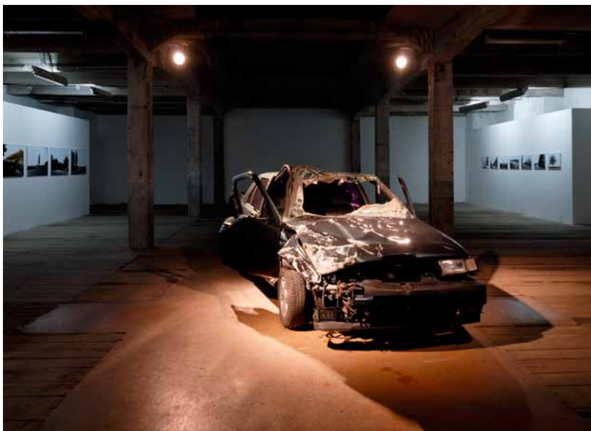
Eugenio Percossi: Forever